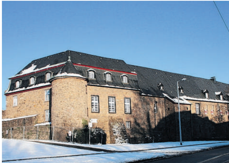
Jahrhundertealtes Wahrzeichen des Stadtteils: das Schloss Broich.