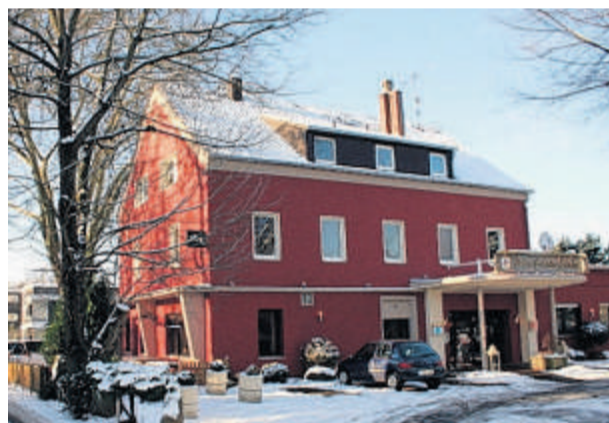
Erstrahlen in neuem Glanz: die Prinzess-Luise-Stuben.

Broich ist zu jeder Jahreszeit ein Stadtteil mit vielen schönen Ecken, prachtvollen Gebäuden und sehenswerter Landschaft. Der Winter jedoch zaubert Jahr für Jahr eine ganz besondere Stimmung herbei. Wenn dann noch strahlender Sonnenschein und klirrende Kälte hinzukommen, weiß der aufmerksame Betrachter oft kaum, wohin er den Blick wenden soll.