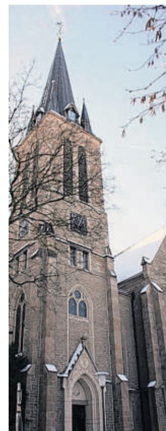
Eindrucksvolle Architektur vor wolkenlosem Himmel.