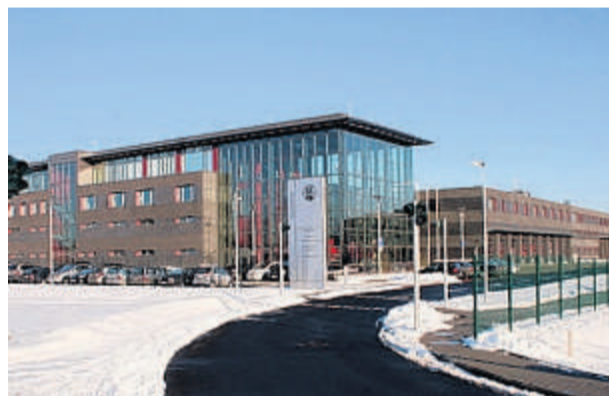
Auf dem neuesten Stand der Technik: die Feuerwache.