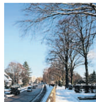
Der Winter macht aus der Holzstraße ein Schmuckstück.