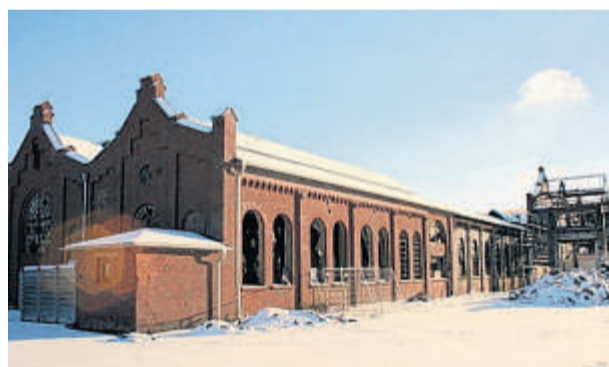
Restaurationsarbeit für Jahre: die Alte Dreherei.